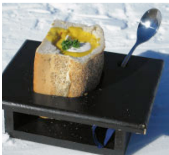
Den lokale specialitet: et halvt fransbrød med karryblanding.

” Trysil har det hele – en god blanding af herligt skiløb og et eldorado af andre aktiviteter.