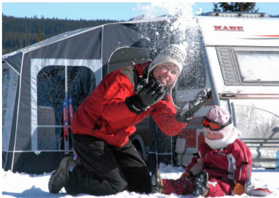
Campingvognen er vores base, og vi har alt det, vi skal bruge inkl. varme.